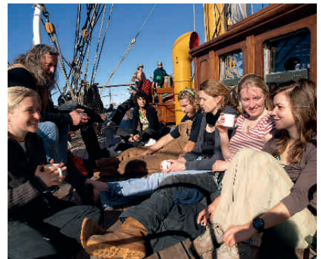
Beim täglichen „Ten-o'clockie“ sammeln sich alle in Lee des Deckshauses